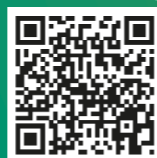
Teilnehmende der Validierungsförderung im Portrait